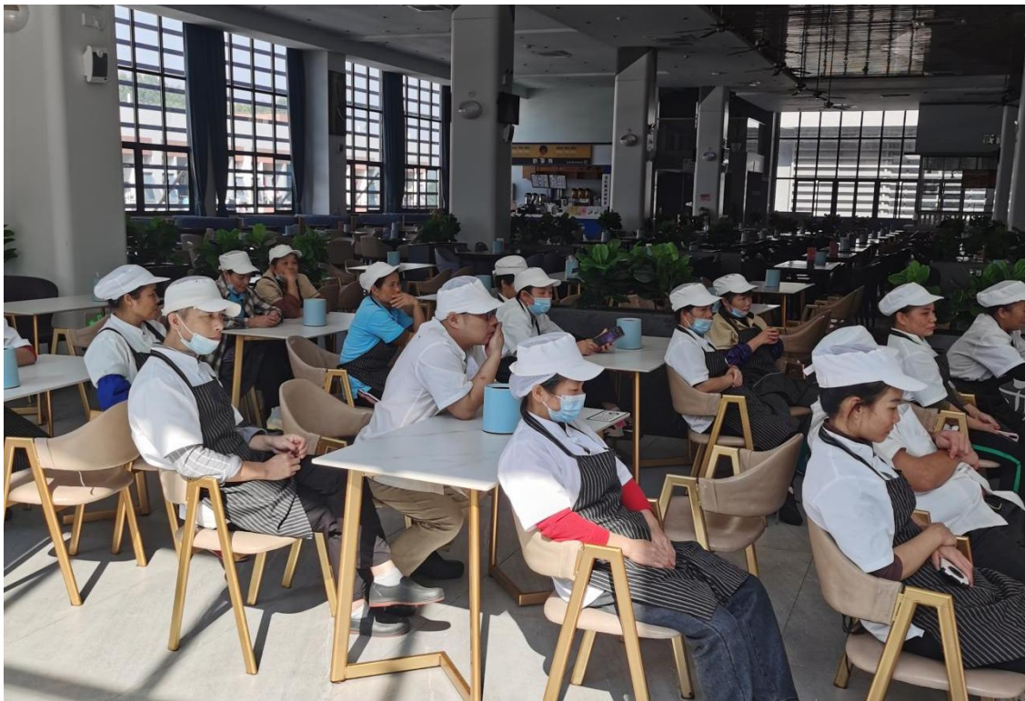
北校区食堂每日晨会聚焦食品安全议题