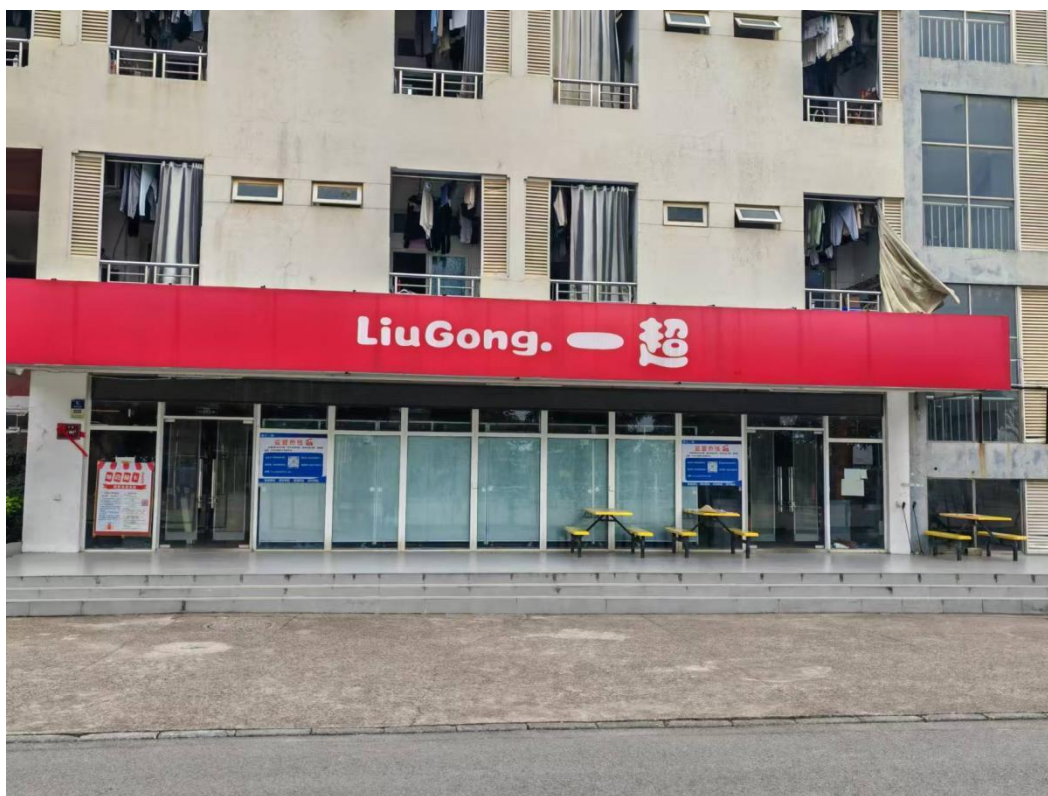
一超市商家正式撤场