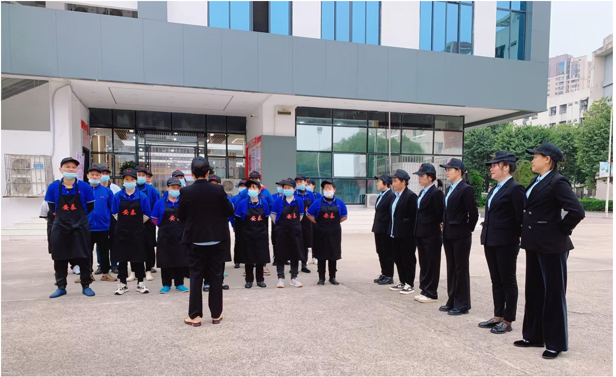
一食堂每日晨会聚焦食品安全议题