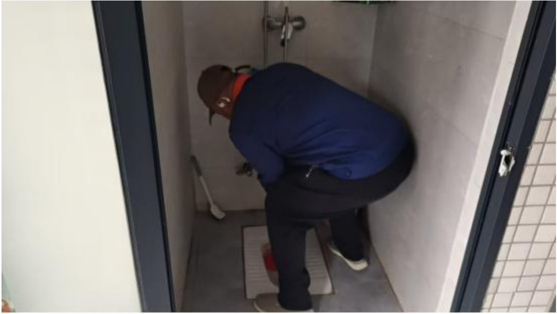
工程师疏通学生宿舍便盆