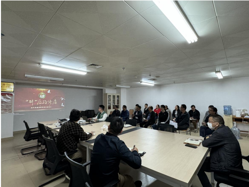
观看交通安全警示教育片