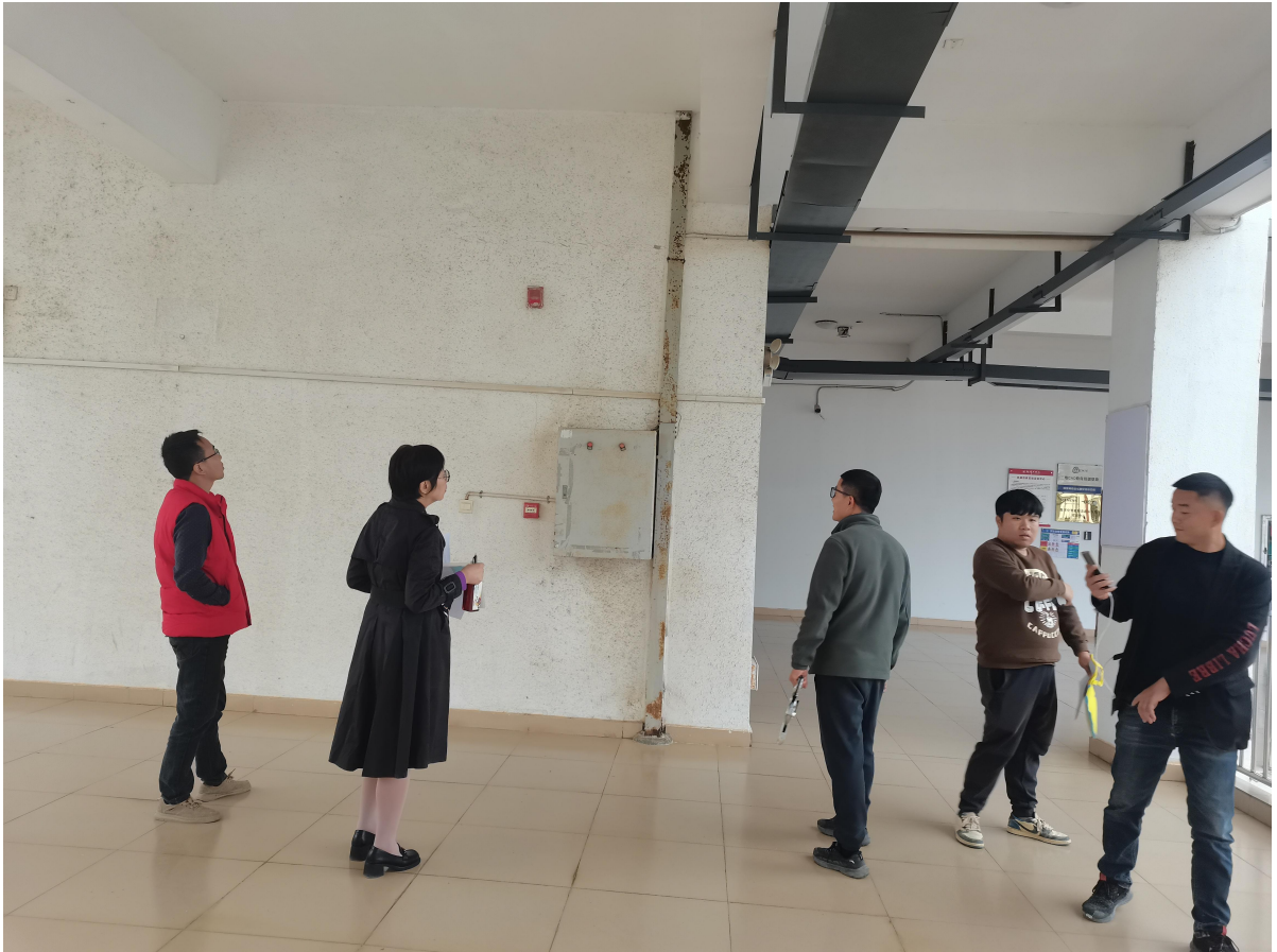
同土建学院老师验收第一实训楼桥架除锈刷漆