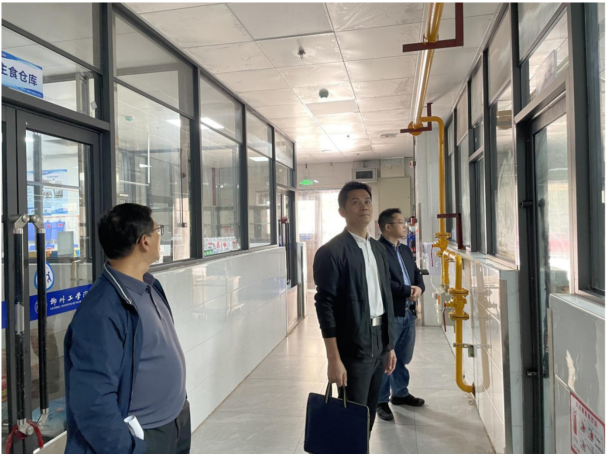
教育厅授权委托广西科技大学执行学校食堂专项检查任务