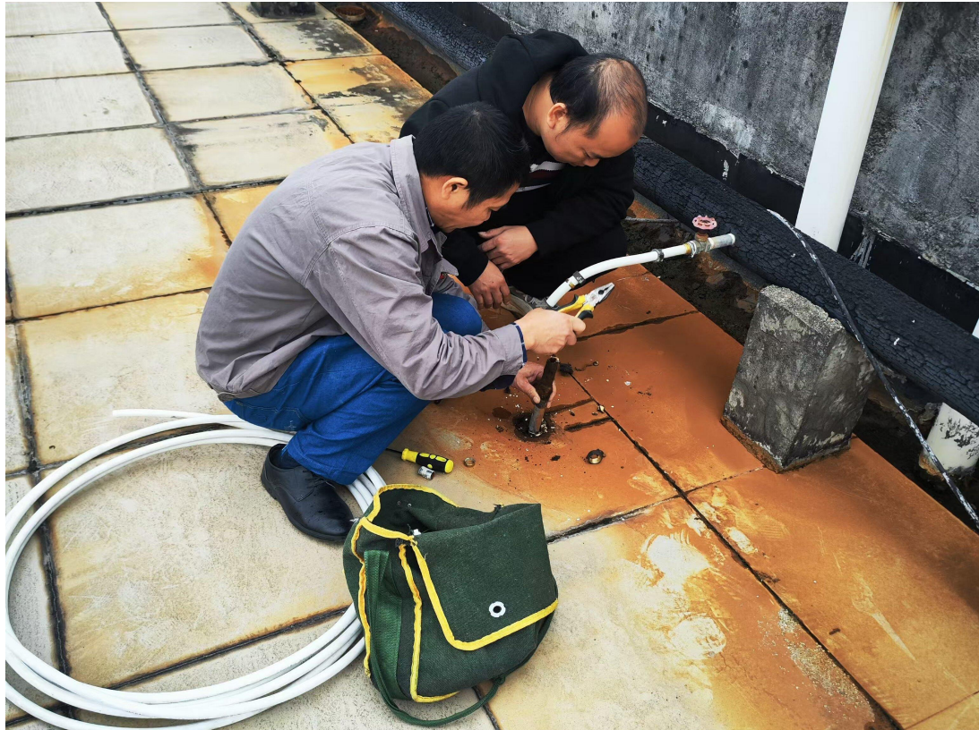
南校区第七栋宿舍楼楼顶热水回水管路维修