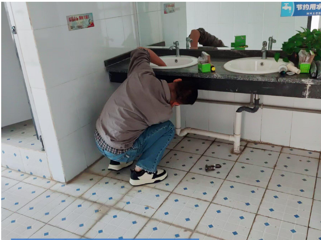
南校区第二教学楼洗手台排水管检修