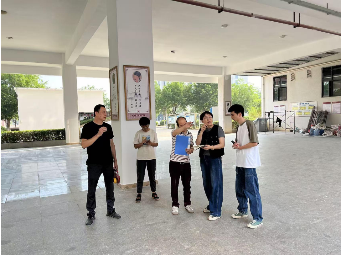
验收第二教学楼零星维修