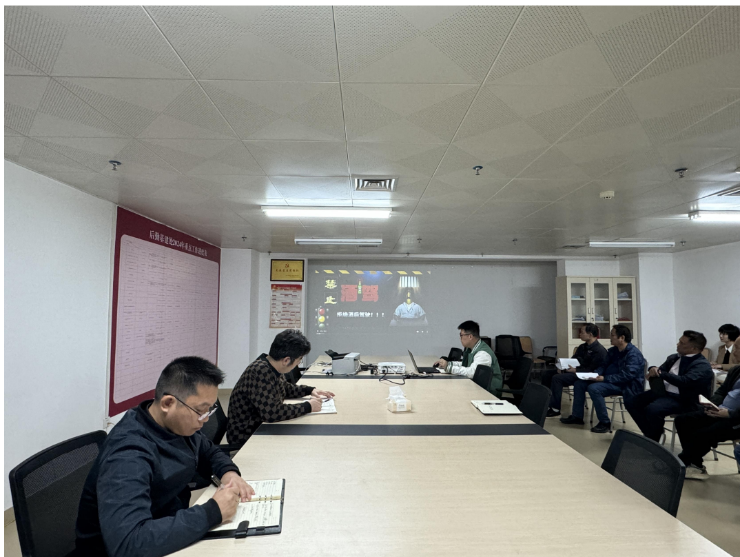
观看交通安全警示教育片