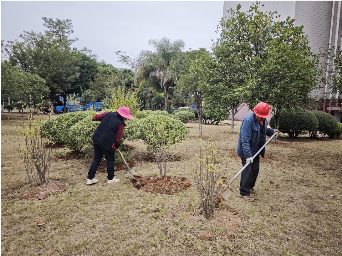
校园内做好秋冬季松土围堰