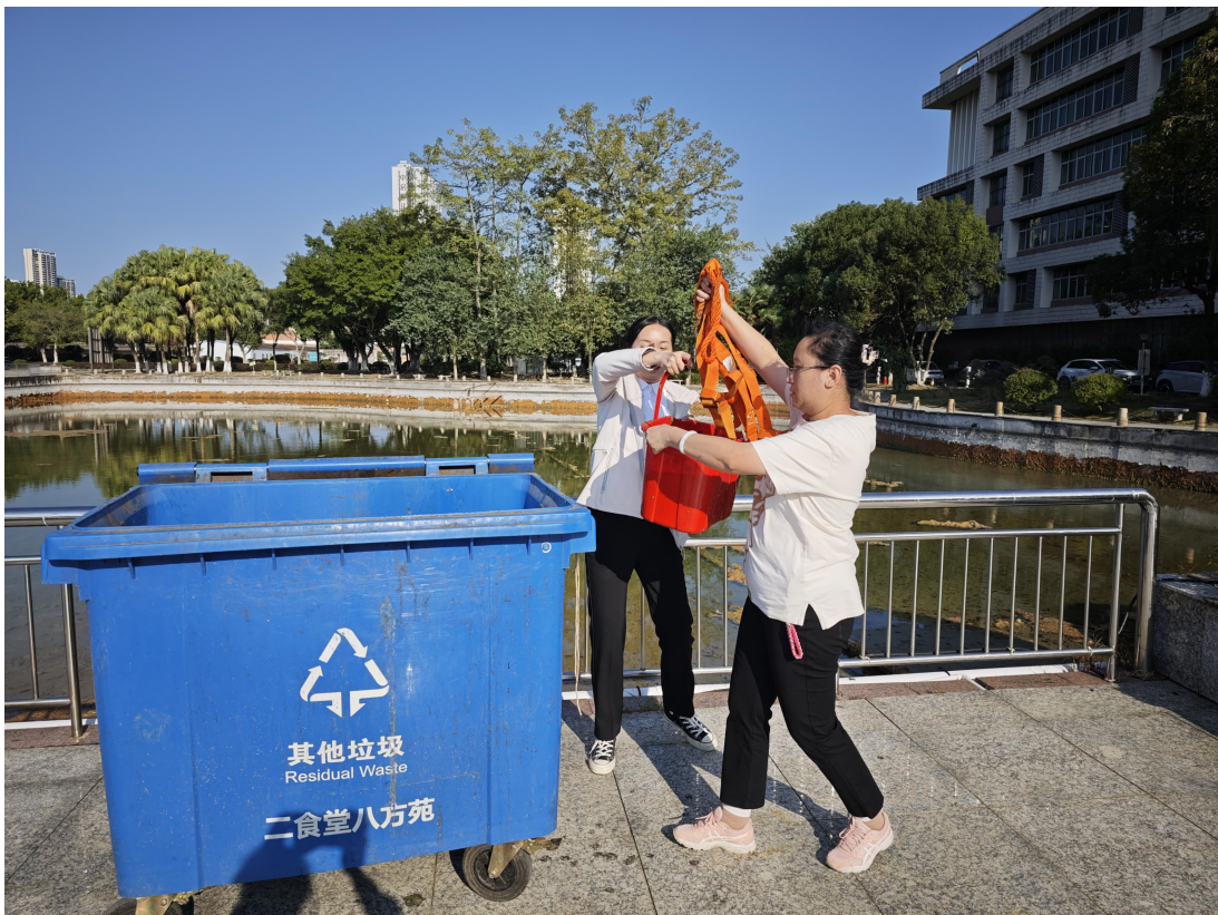
设计打捞人工湖池底淤泥实践方案