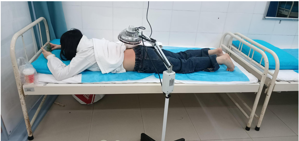
对学生进行远红外线治疗