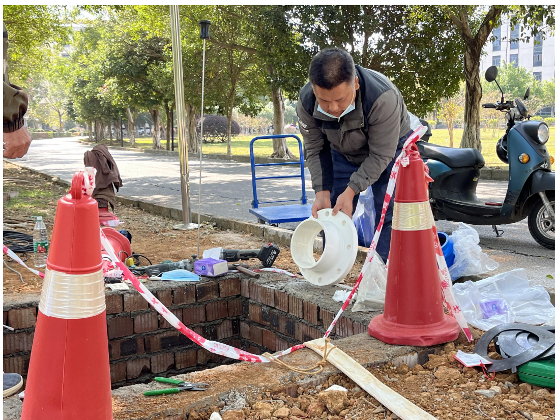
维修地下供水管路