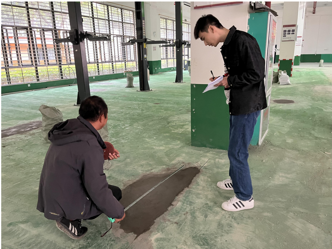
核实零星维修工程量