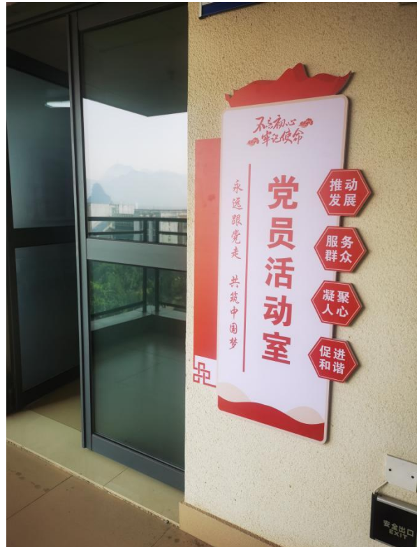
党员活动室宣传阵地建设图