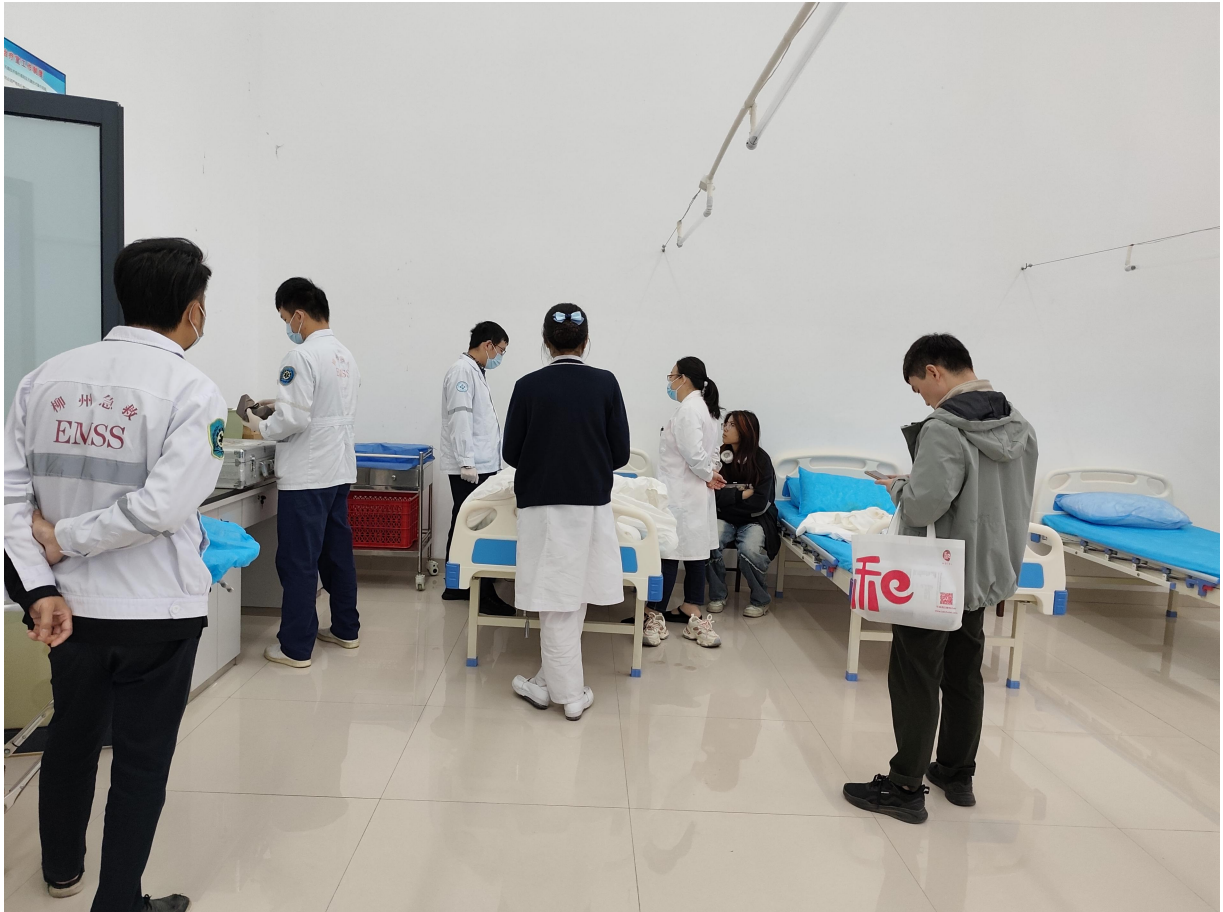
对急重症患者进行转诊