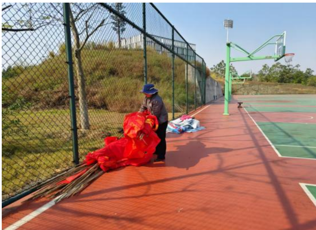
军训结束后清洁现场遗弃物料