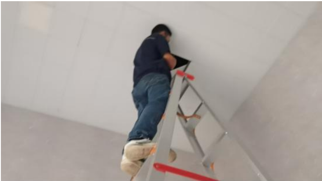
工程师傅维修北校区图书馆天面盖板