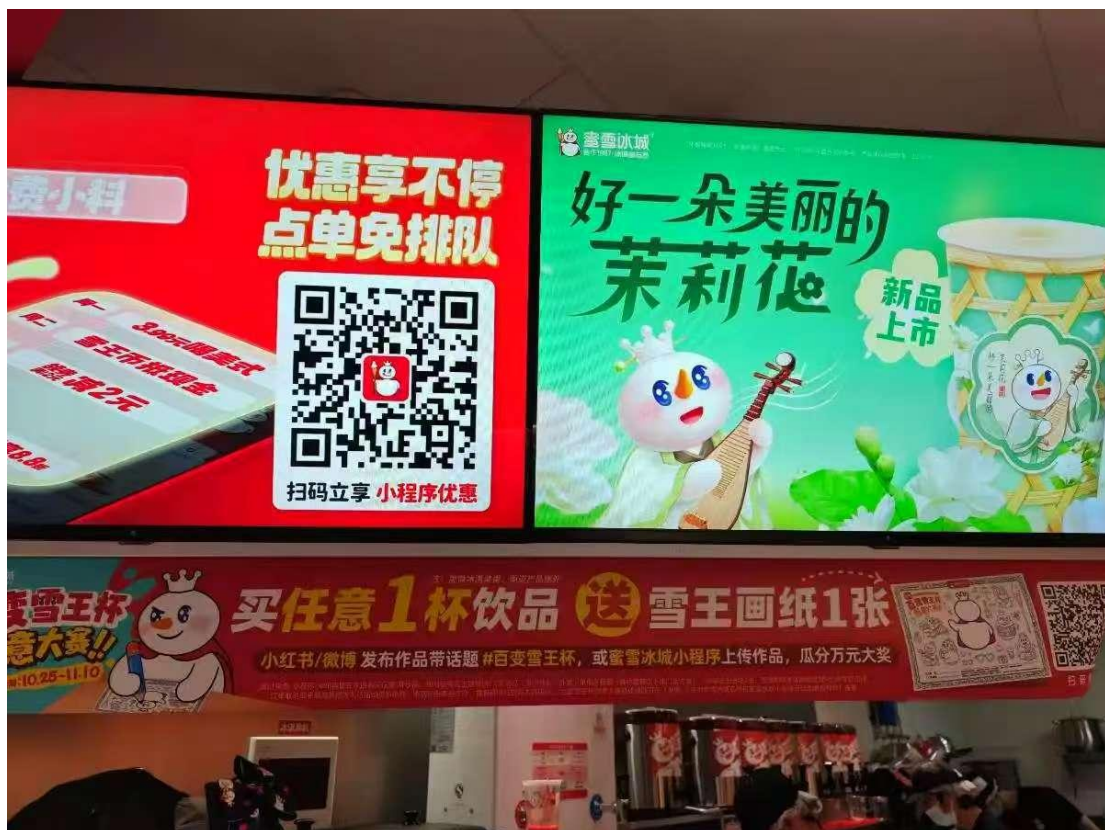
蜜雪冰城推出“百变雪王画纸”活动