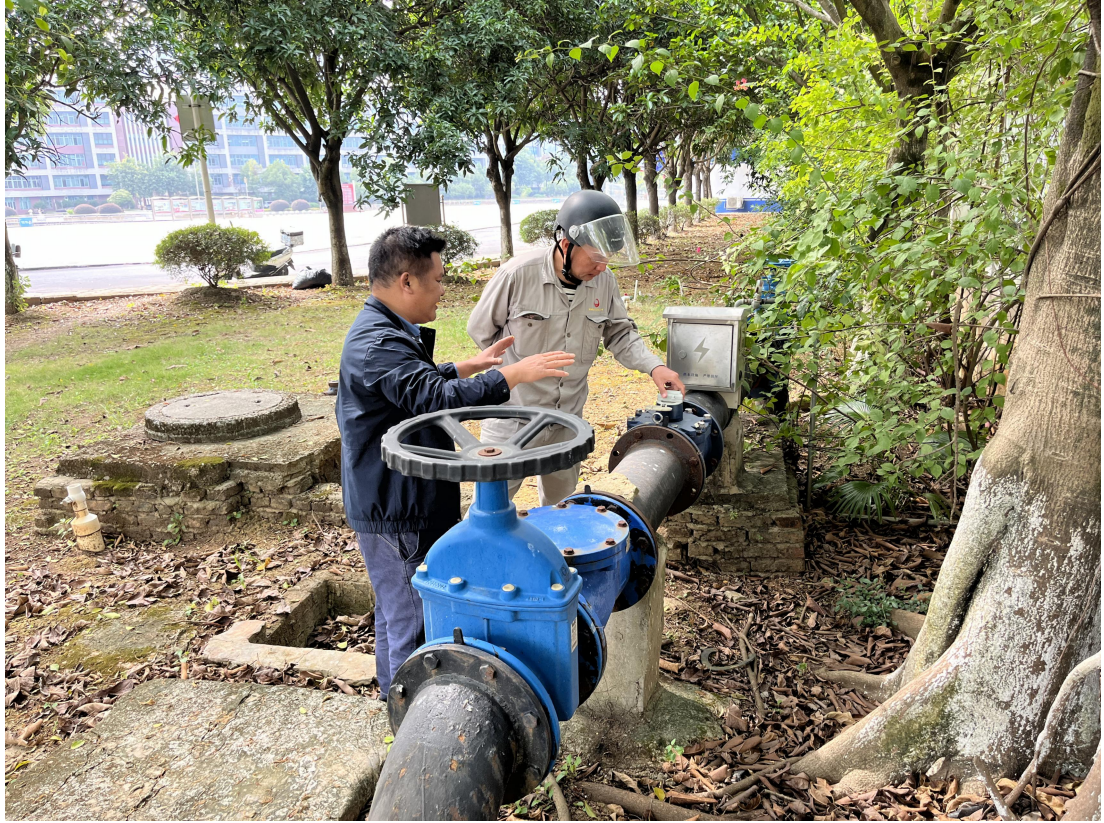
与自来水公司核对水表读数