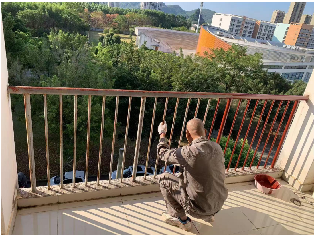
南校区第八栋宿舍楼楼梯阳台护栏粉刷油漆