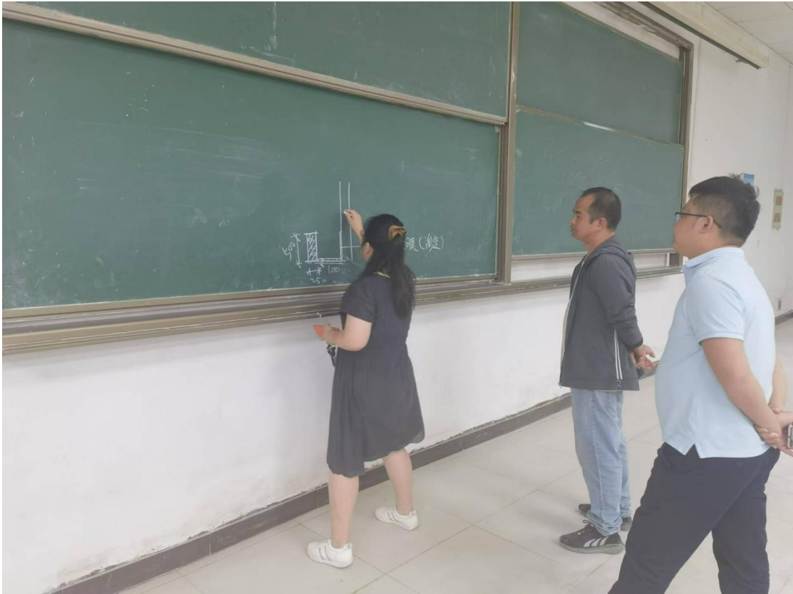
土建学院专家对第一教学楼阶3维修项目，进行方案指导