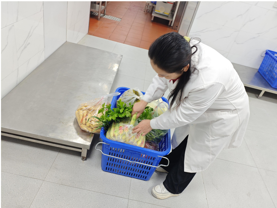
参与学校食堂食材验收及食品安全检查