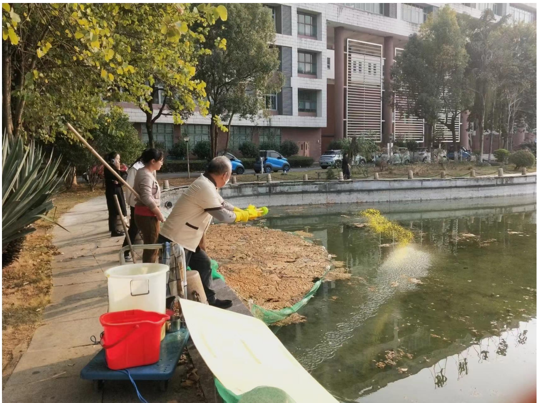
督导交流治理人工湖漂浮物