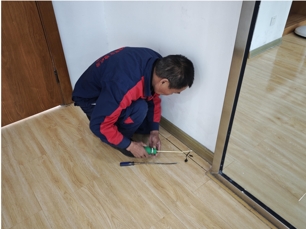
对木质地板结构缝隙处投药预防