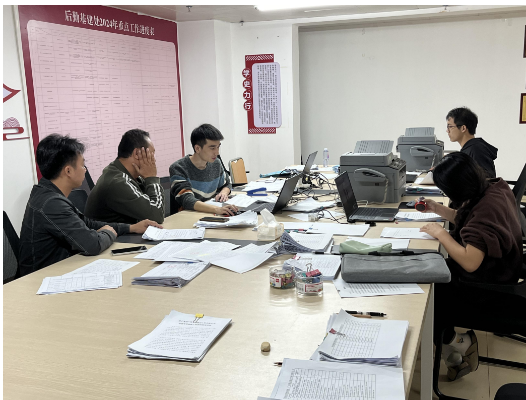
与定点维修单位商讨施工方案