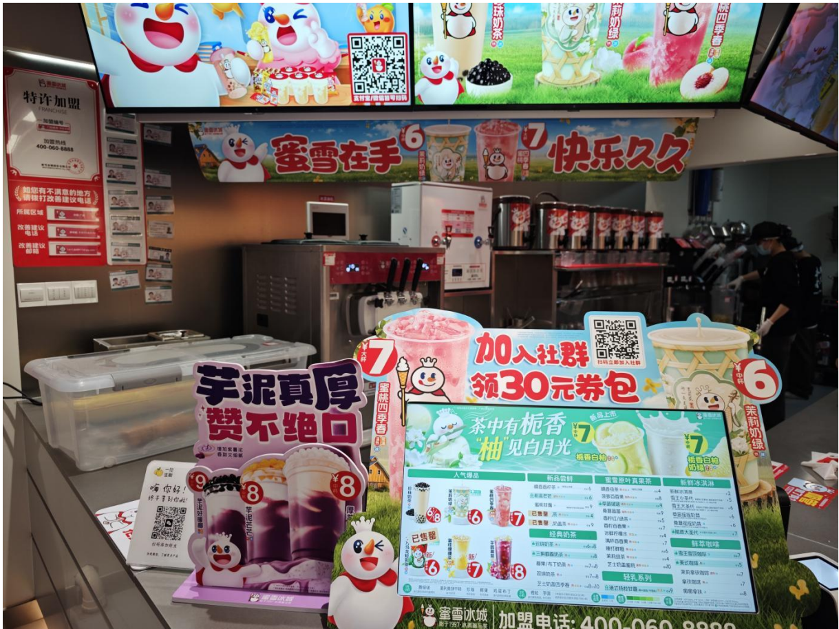
蜜雪冰城推出“蜜雪在手，快乐久久”活动