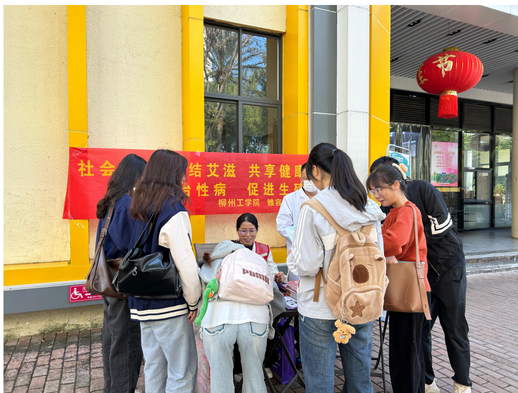
举办关于艾滋病咨询与体重健康教育活动