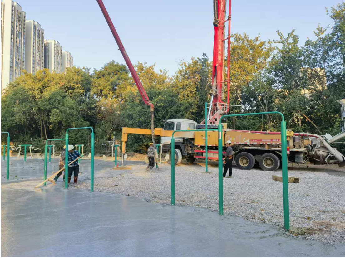
田径场健身路径维修项目施工中