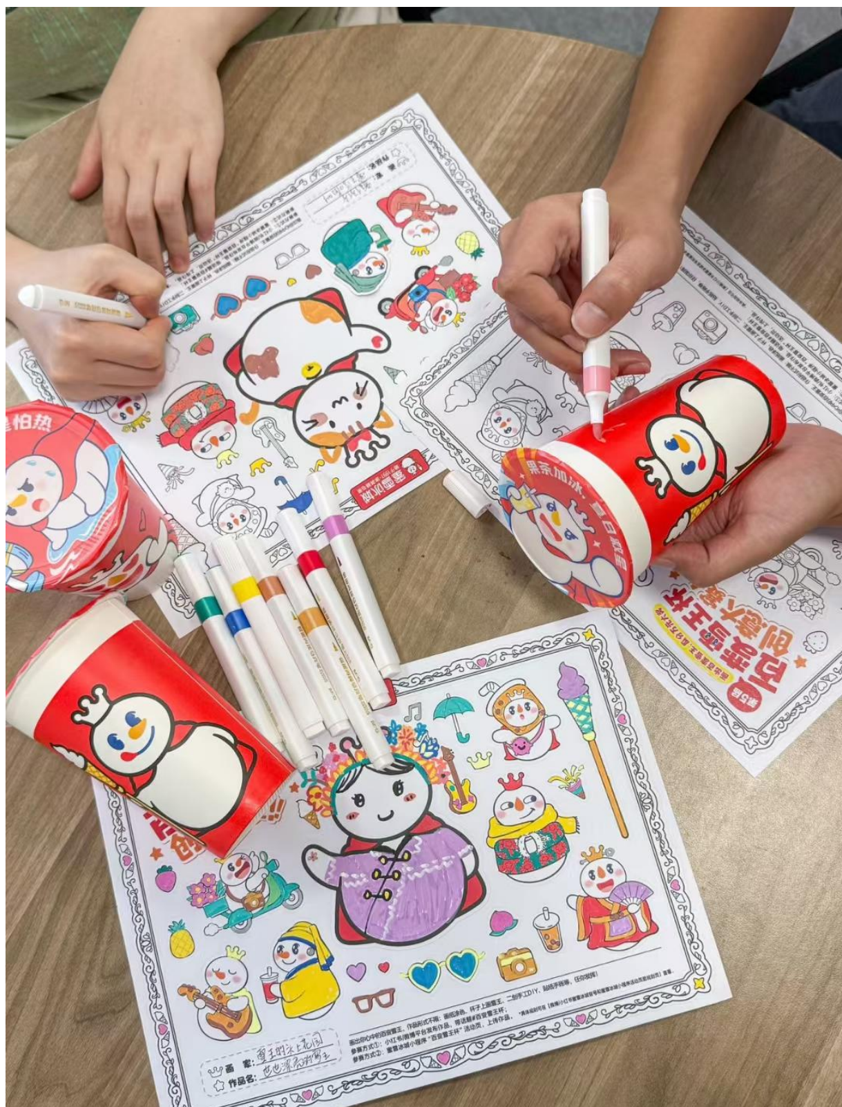
学生参与“百变雪王画纸”活动现场