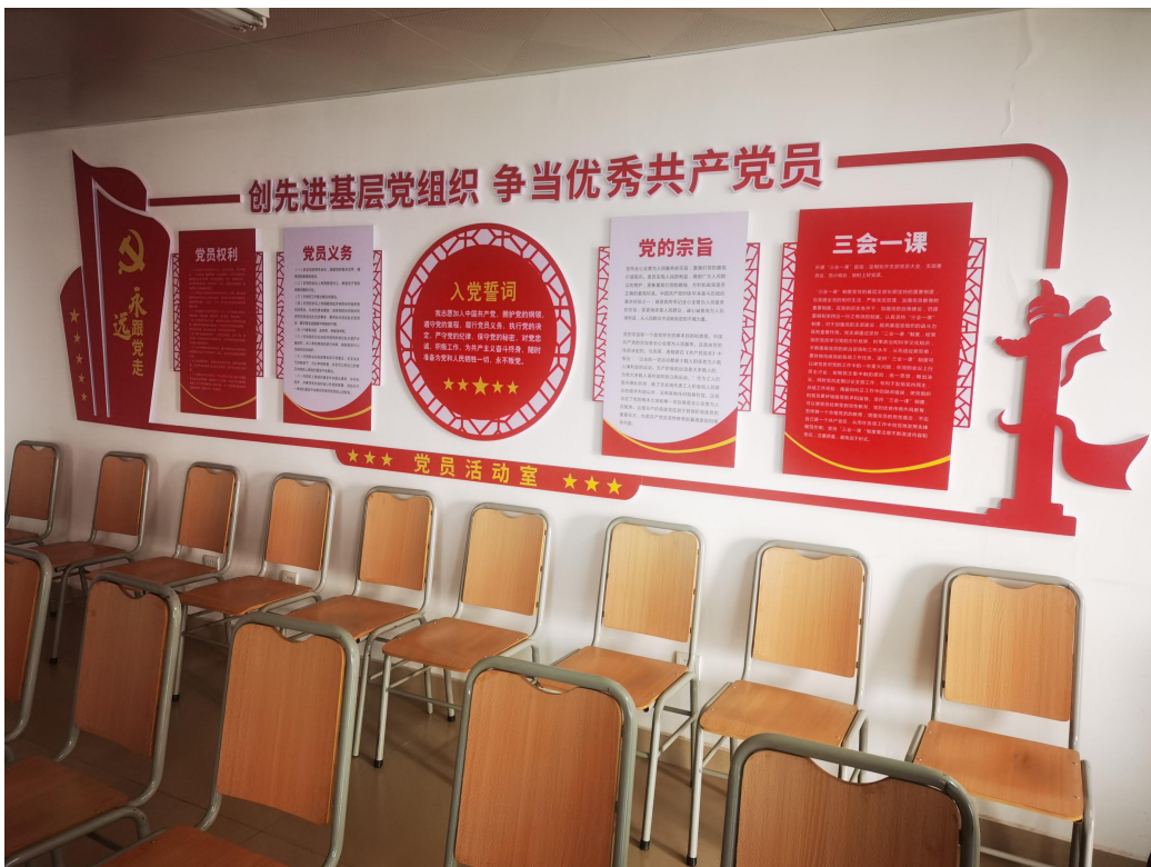
党员活动室宣传阵地建设图