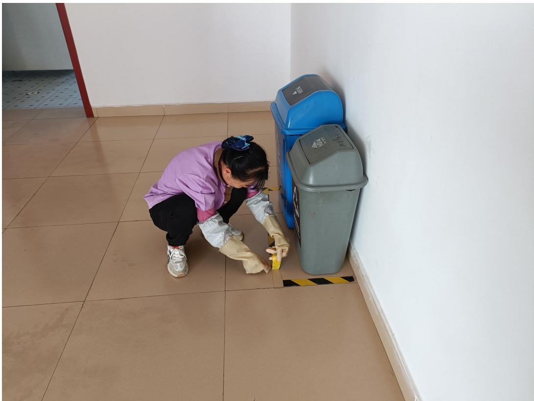
对一实训各楼层分类垃圾桶地面地标线更换标识贴