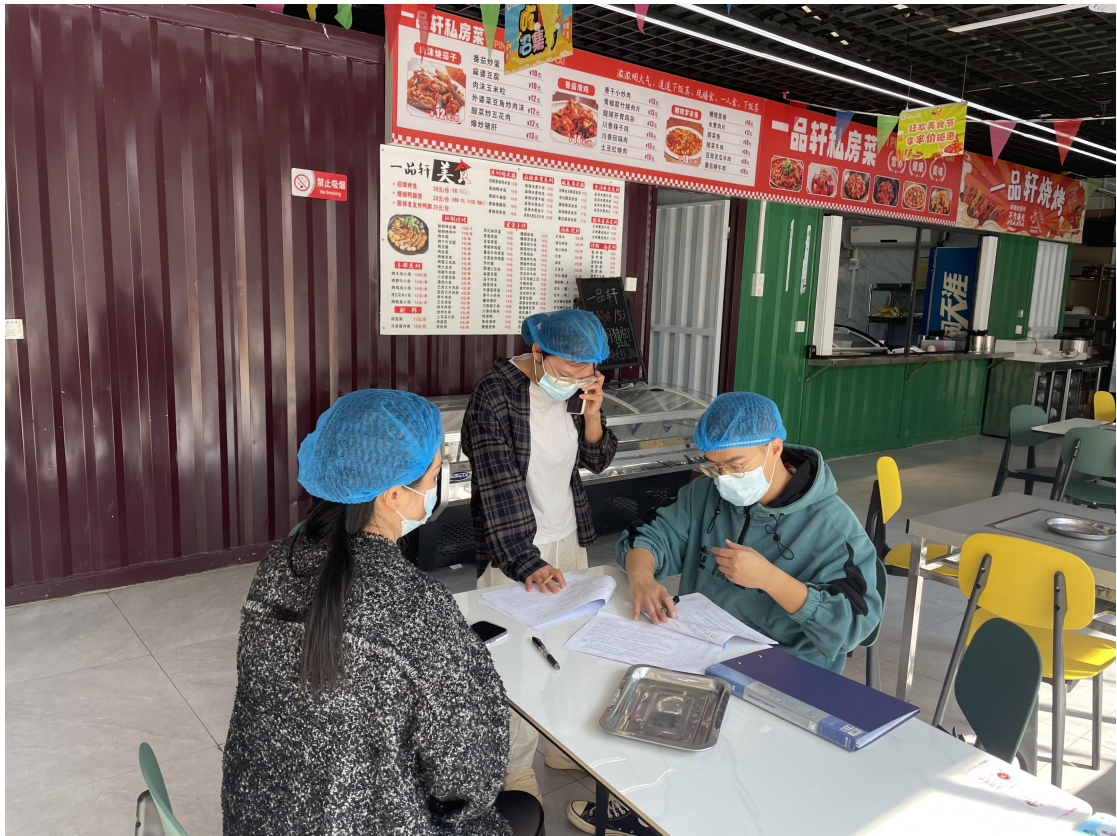
鱼峰区市场监管局对我校美食街开展食品安全许可专项检查