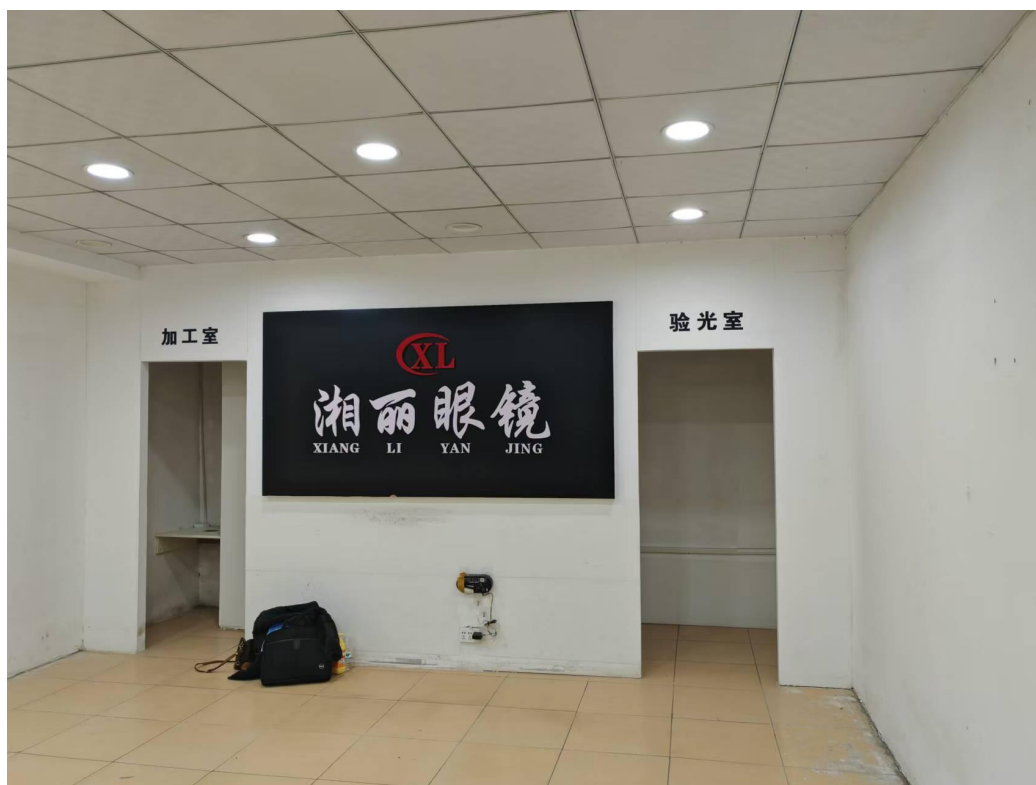
眼镜店合同到期进行撤场