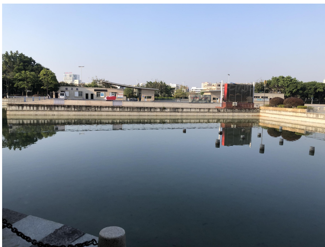
清理人工湖池壁青苔（清理后）