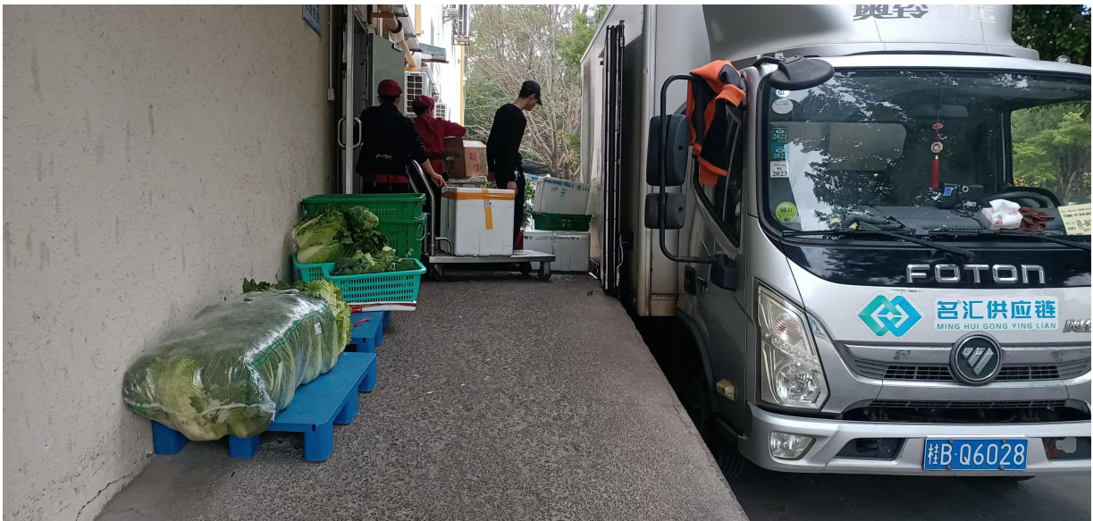
参与学校食堂食材验收及食品安全检查