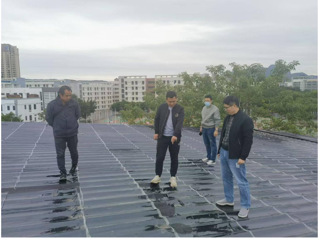
验收风雨操场屋面防水维修