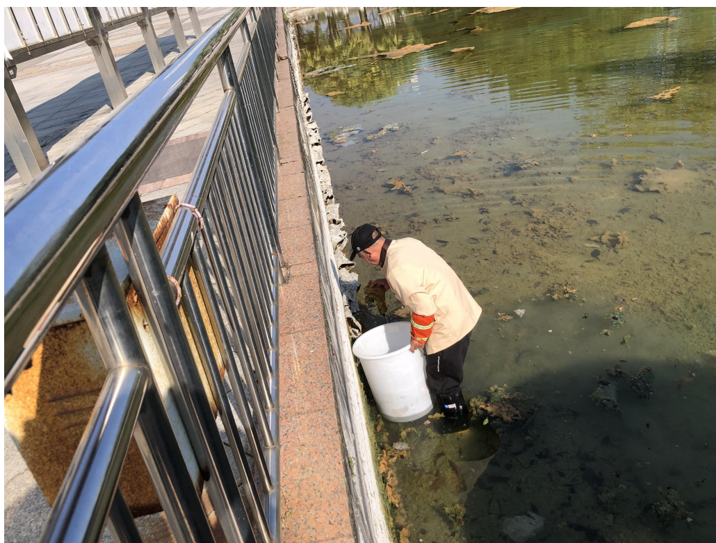
清理人工湖池壁青苔（清理中）