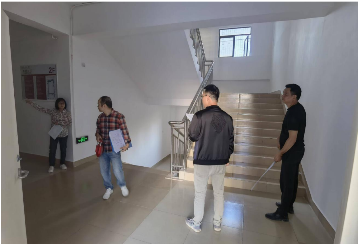
对第二实训楼墙面翻新进行验收