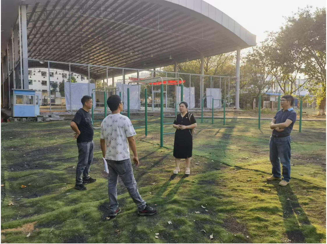
现场确定田径场健身路径维修方案