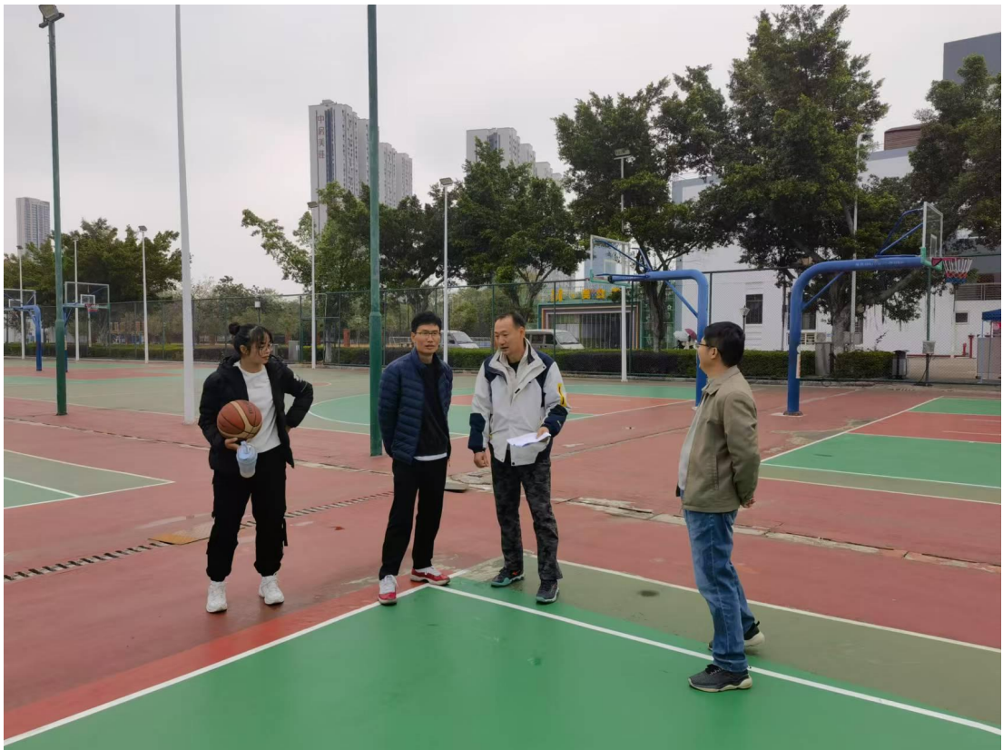
验收篮球场硅铺地面维修项目