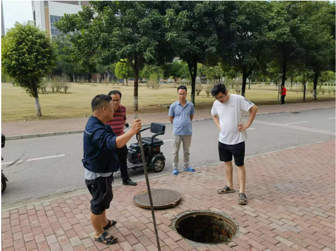
校内给水管破裂，排查渗漏水情况