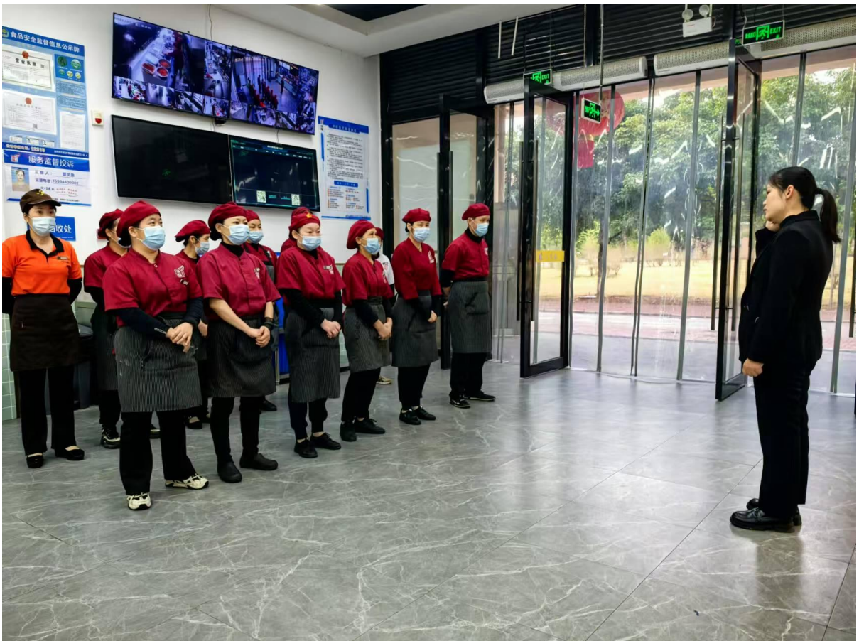
二食堂每日晨会聚焦食品安全议题