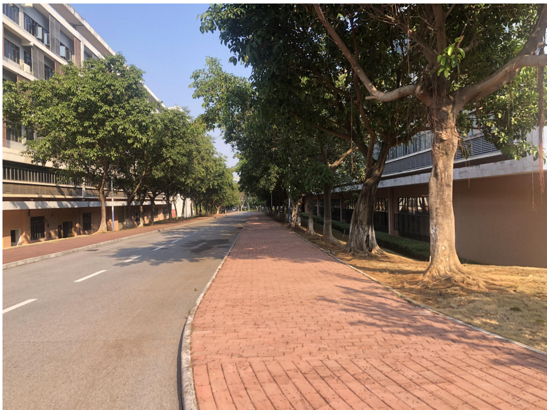
清洁之后二三实训楼之间的校道