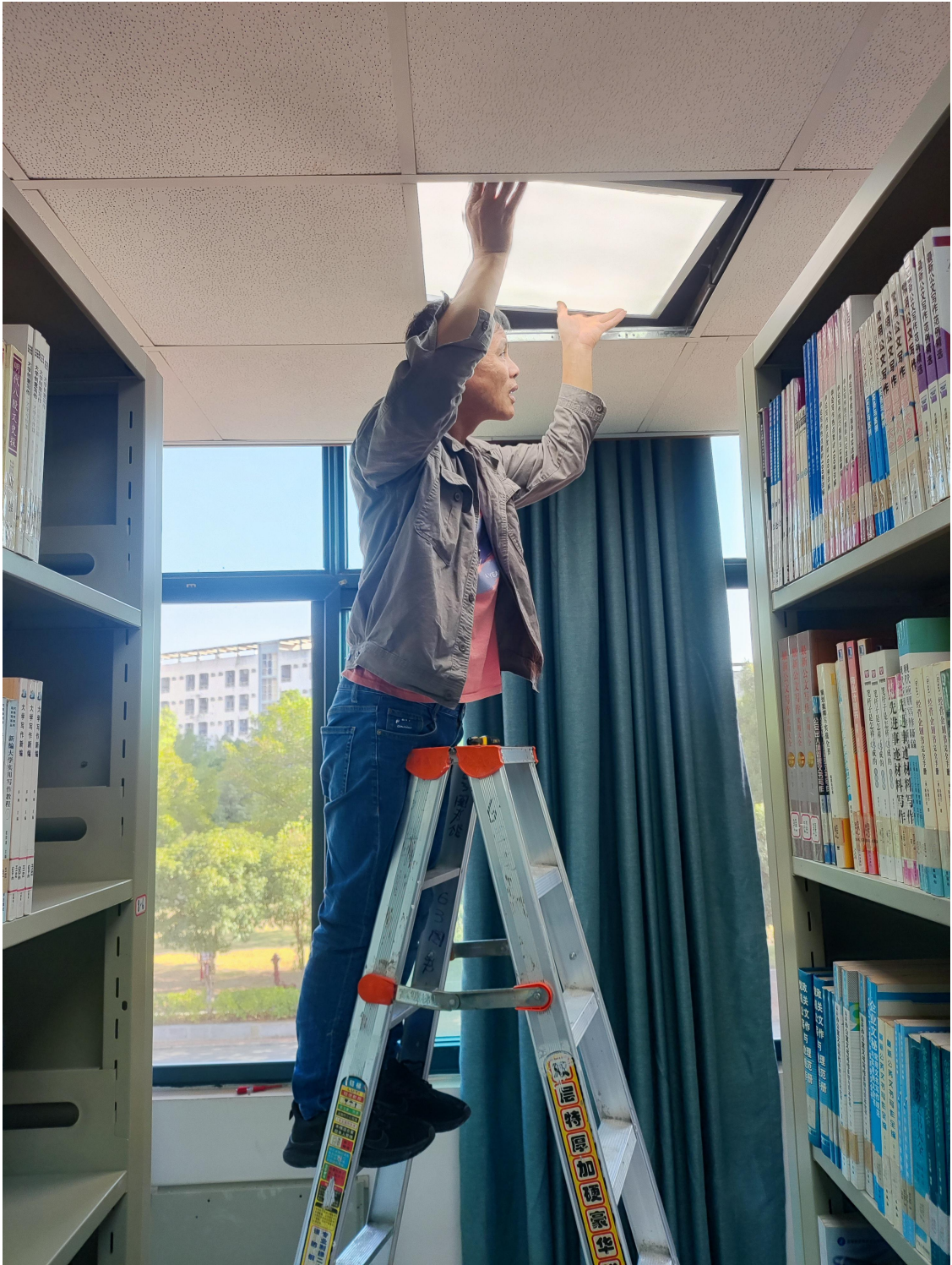
一教西南角漏水点抢修工作