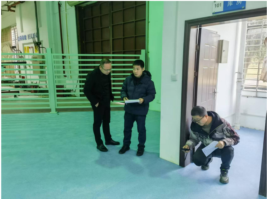
验收第一实训楼106实训室装修项目