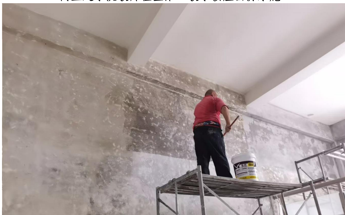
图书馆楼梯间墙面腻子维修