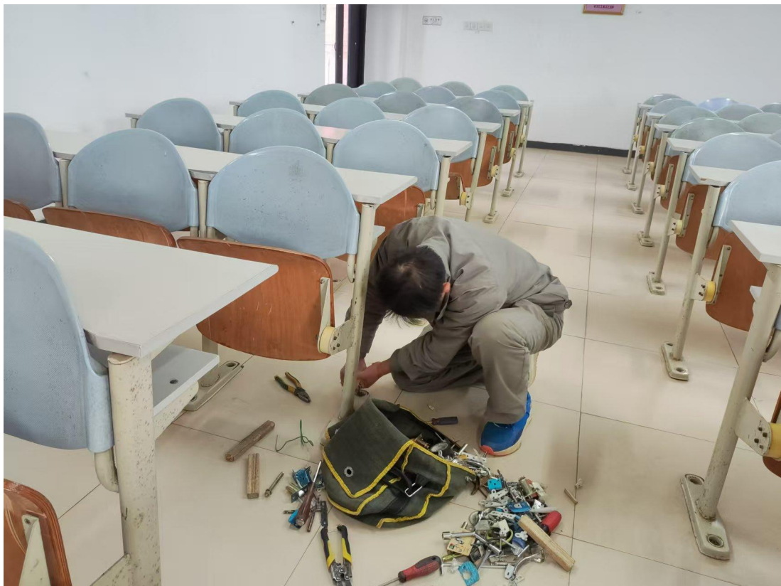
南校区第一教学楼阶梯教室课桌维修