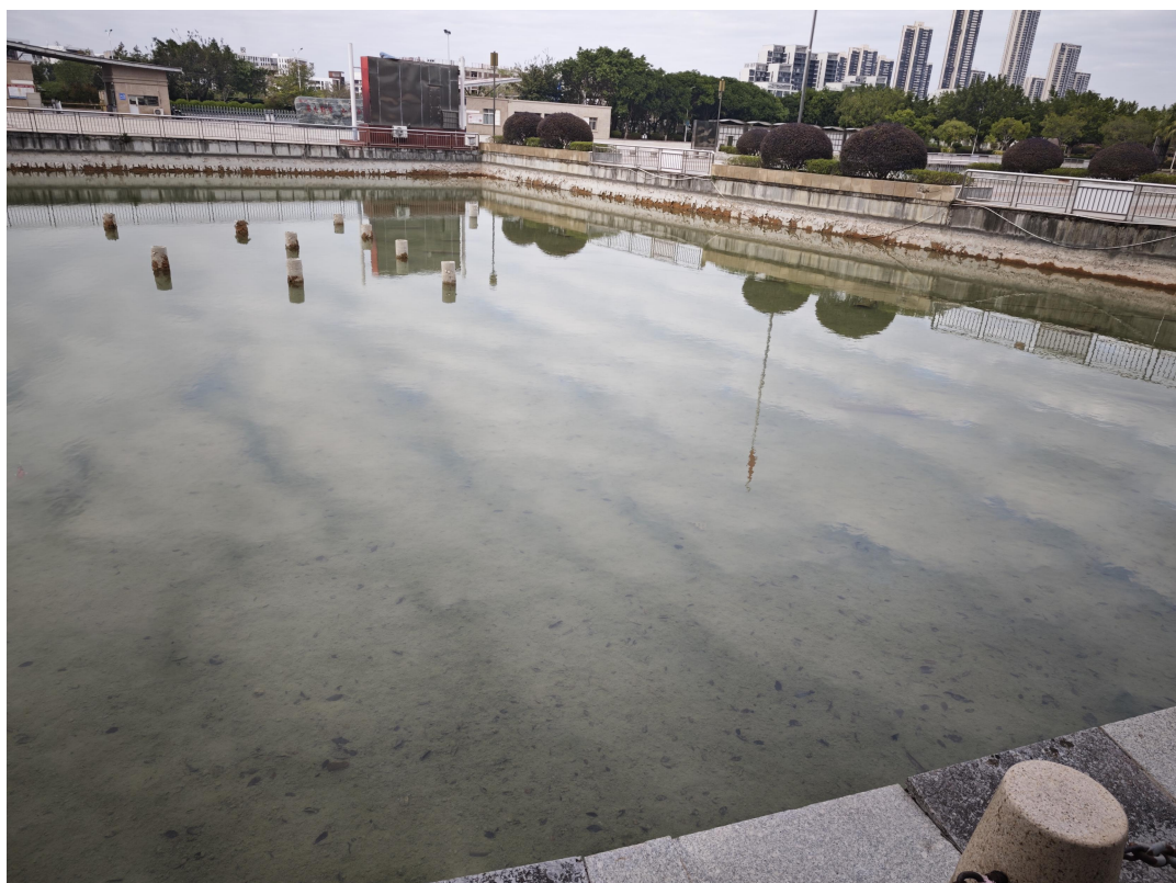
清理人工湖池壁青苔（清理前）