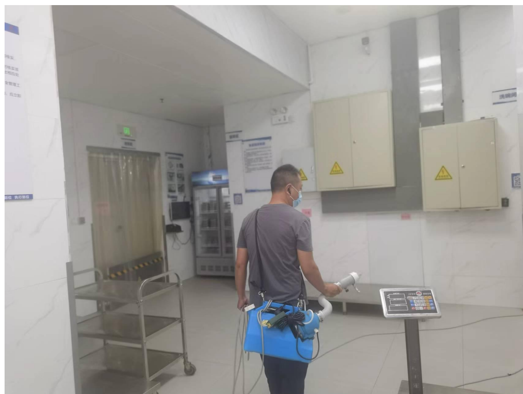
学校食堂每月例行开展有害生物防治