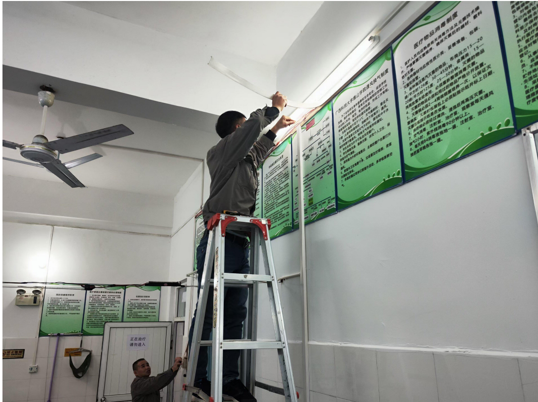
南校区第二宿舍楼学校卫生所安装消毒灯管