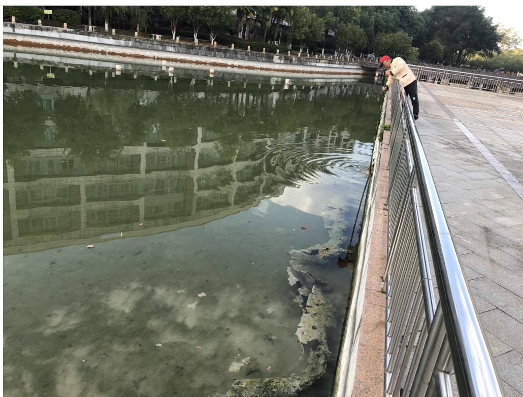
清理人工湖池壁青苔（清理中）