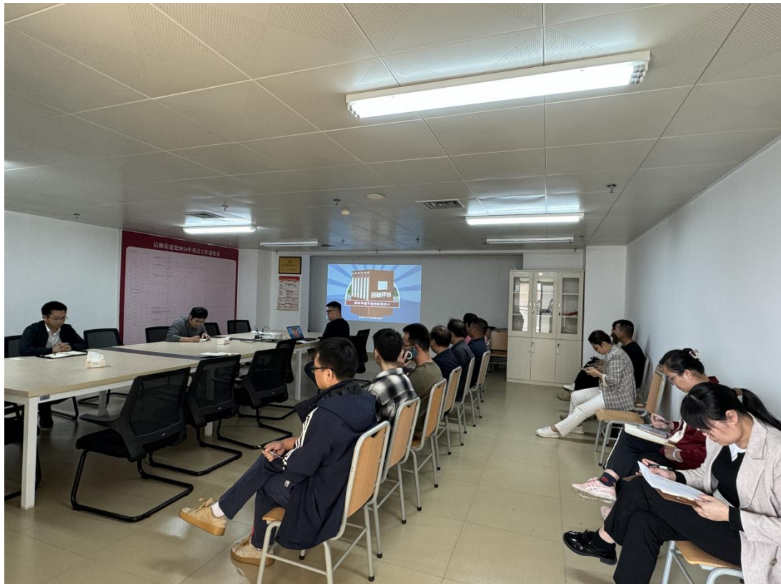
本科教学工作合格评估专题学习会现场