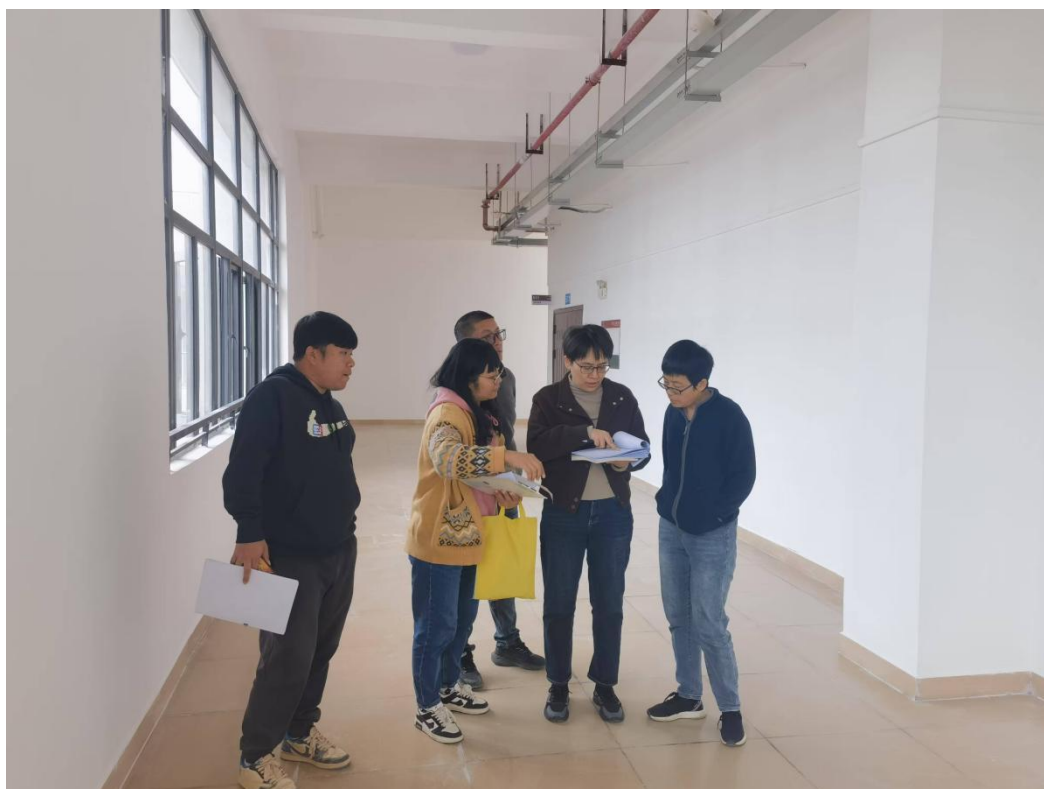
验收第二教学楼零星腻子维修