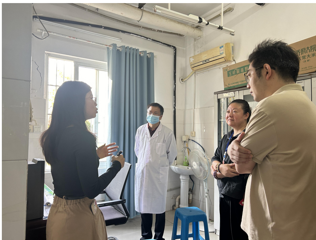
疾控中心人员到校了解水痘疫情