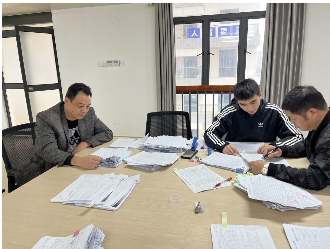
与定点施工单位核对工程任务单