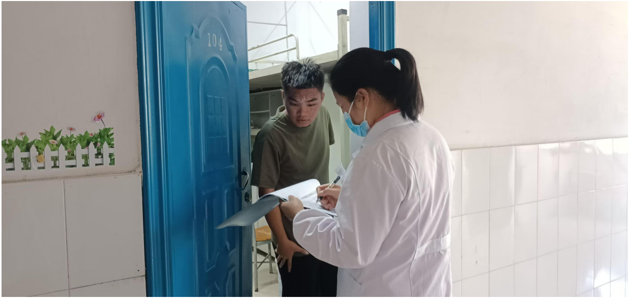
医生到隔离房查房