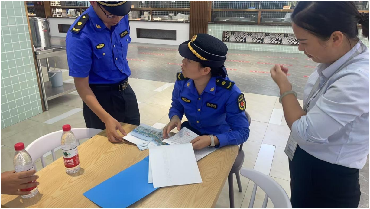
柳东城市执法局领导到学校检查泔水回收情况