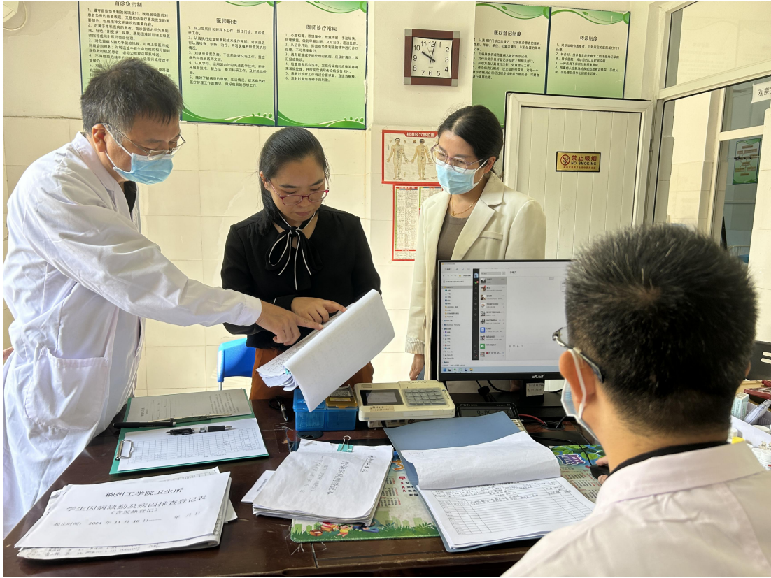
卫生监督所到卫生所进行现场校验