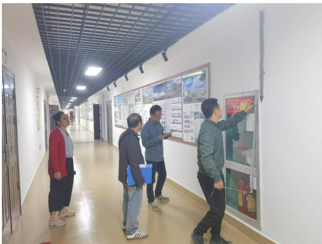
维修项目初验收及卫生工作检查