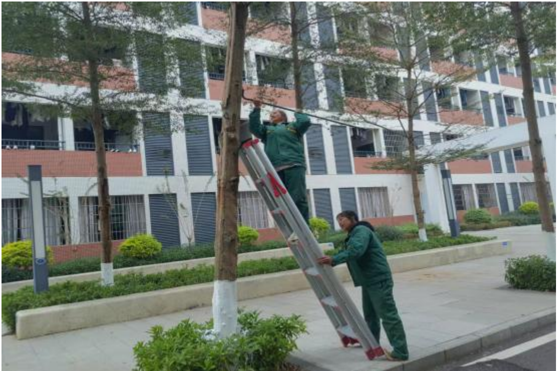
清理树枝上的残留钉子