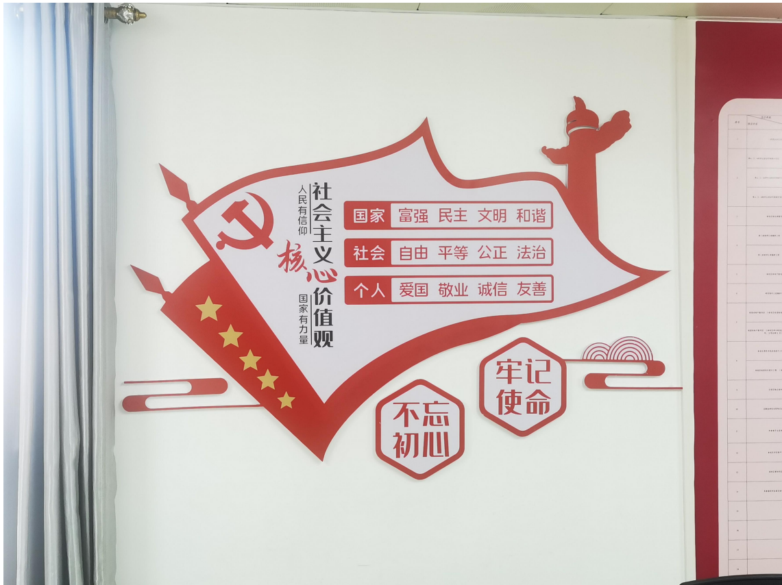
党员活动室宣传阵地建设图