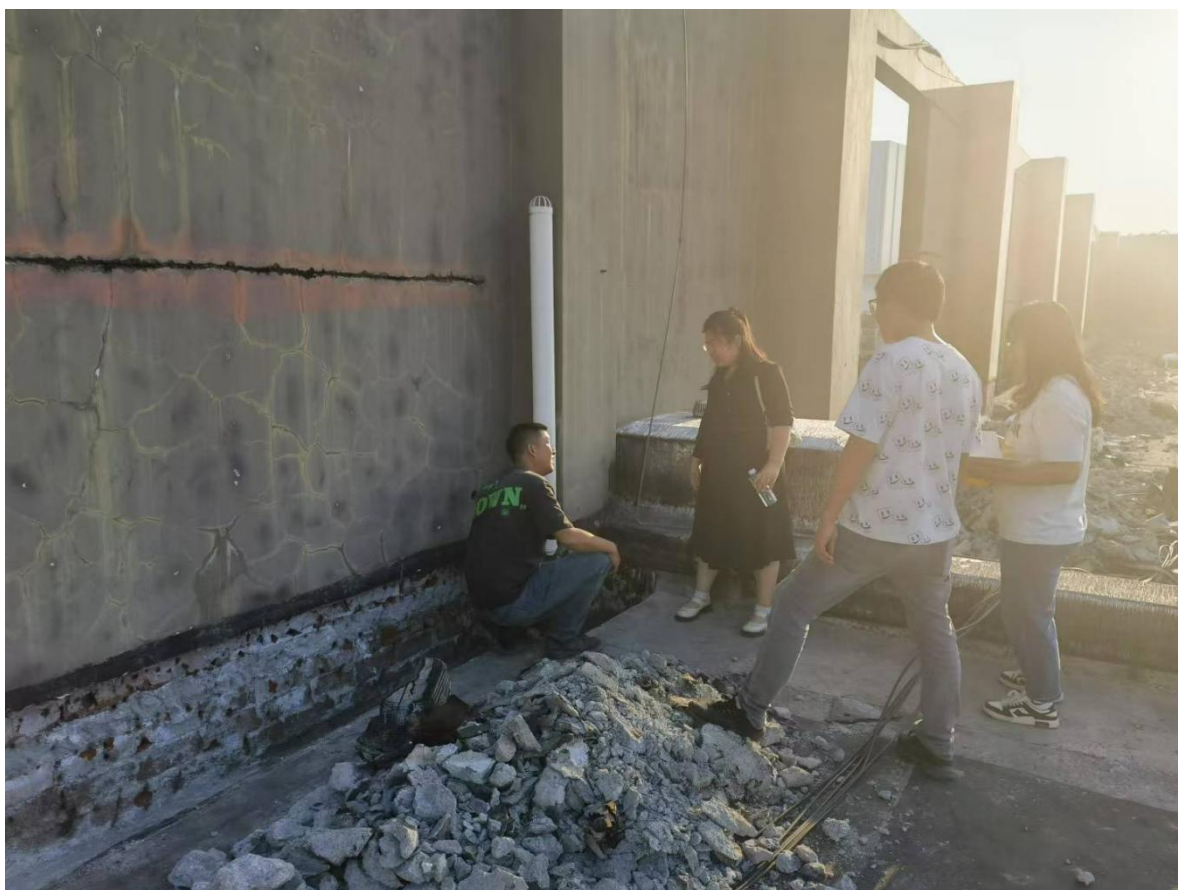
同土建学院教师检查第一教学楼屋面防水施工