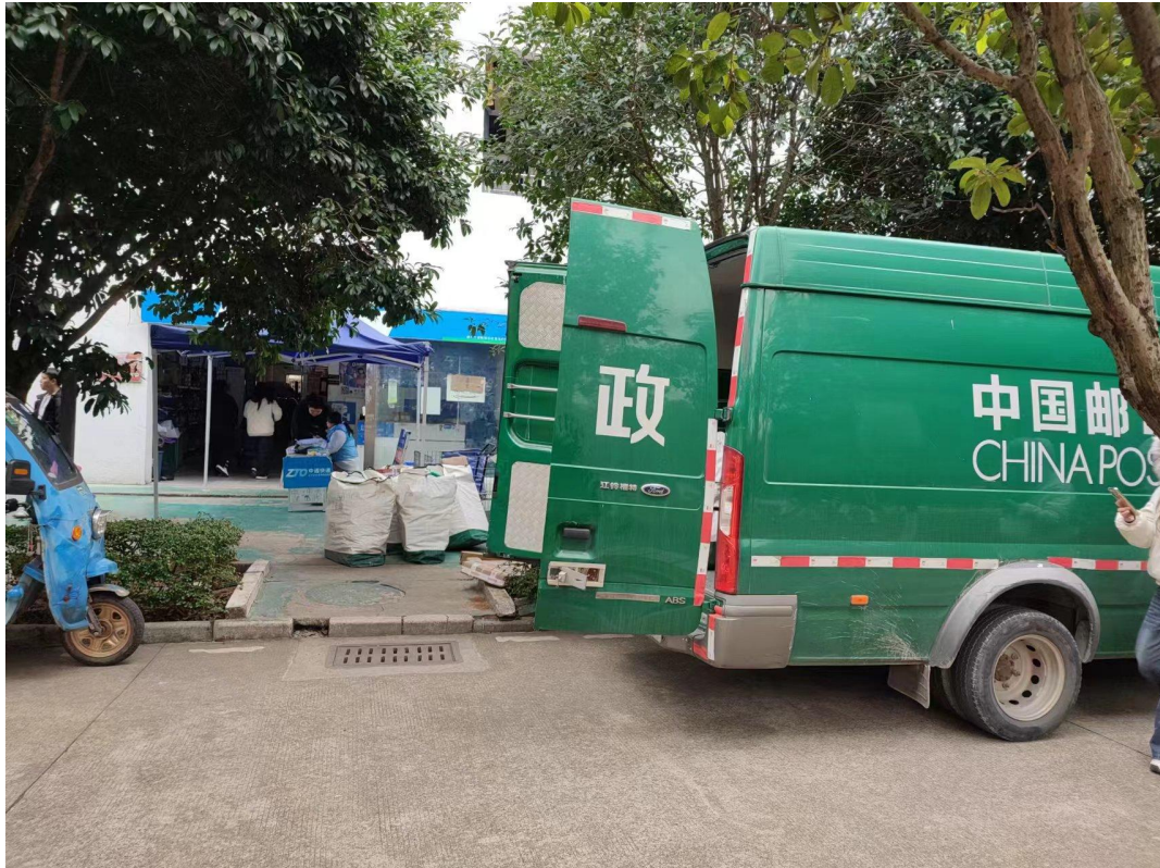
中国邮政服务点从西门搬迁至3栋楼下19号门面