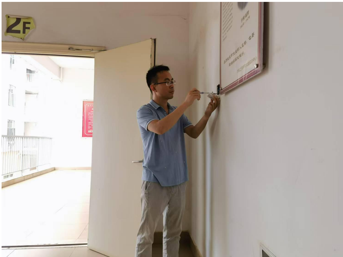
第三实训楼电梯间线路检修