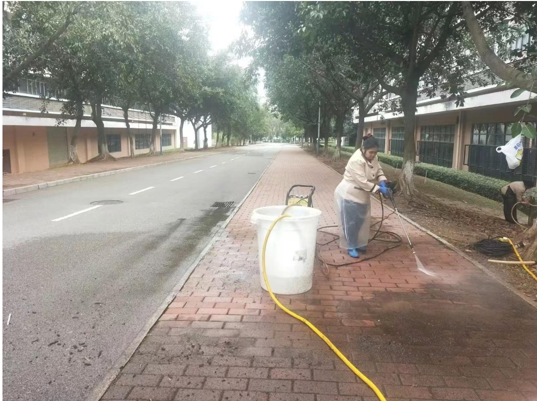
清洁冲洗二三实训楼之间的校道