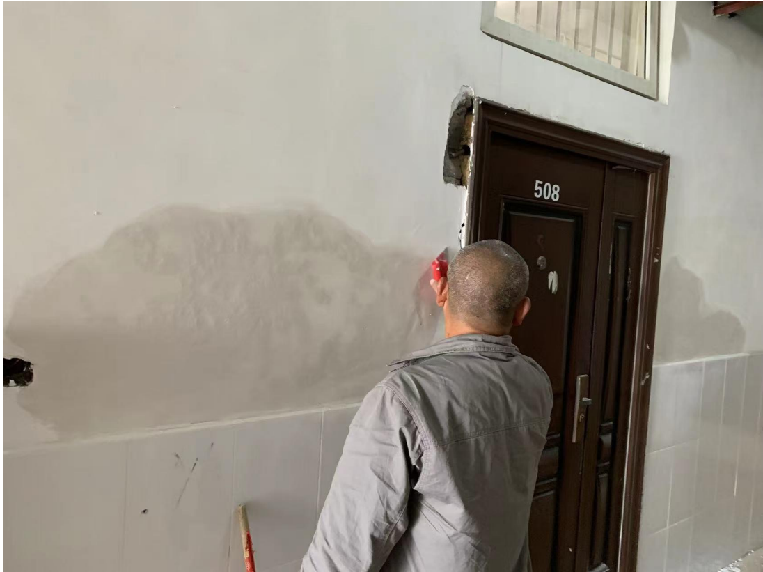
南校区第九栋宿舍楼楼道走廊墙壁补腻子