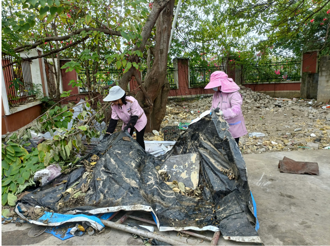
对垃圾场与围墙的夹角大清扫