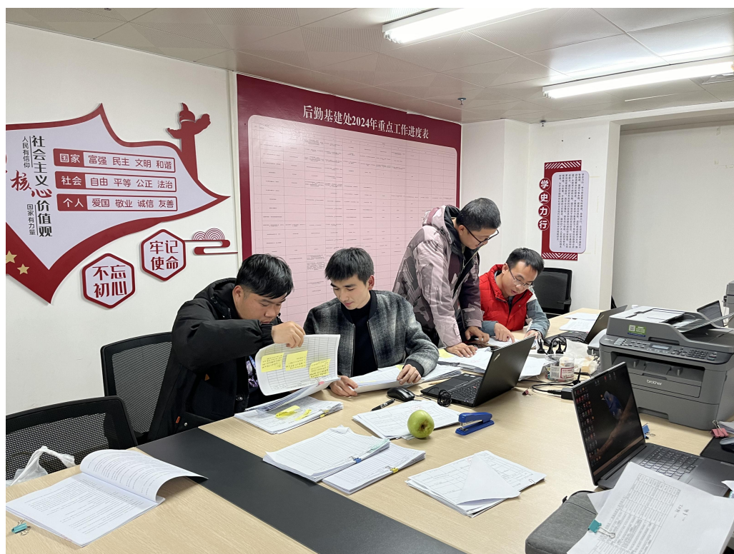
与定点施工单位核对工程任务单