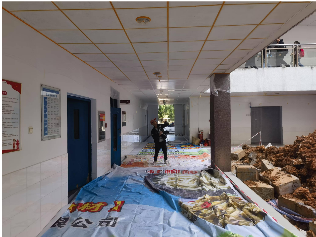
对第一教学楼一楼天棚进行喷漆翻新