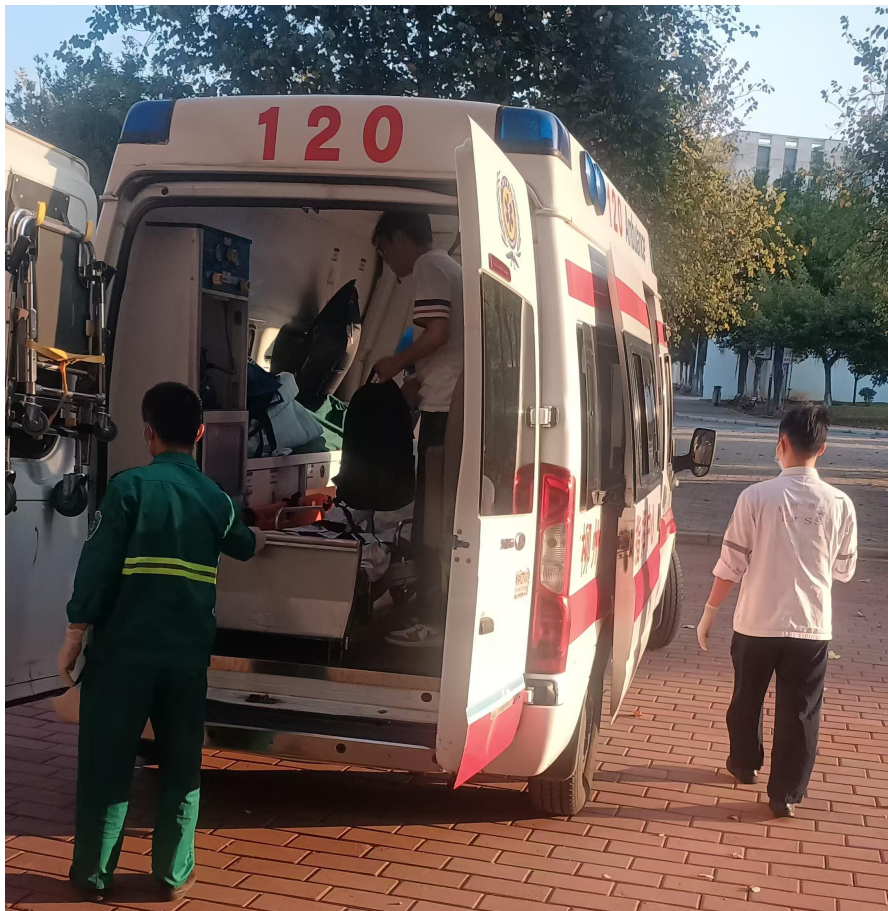
出诊并协助患者转诊