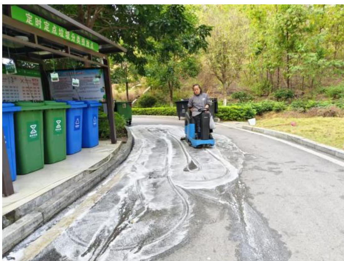
保洁员清理宿舍区路面油渍