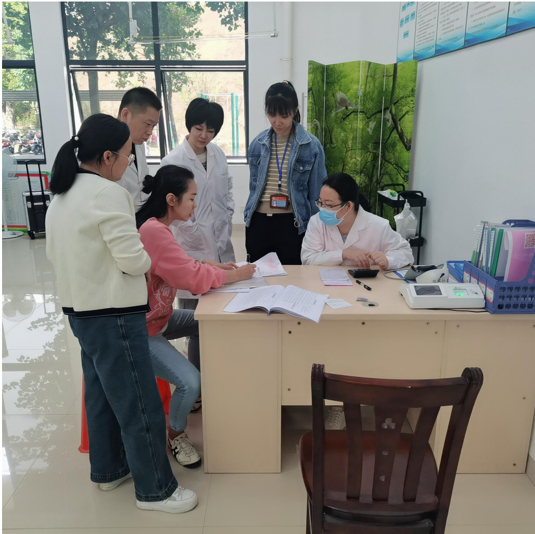
卫生监督所到卫生所进行现场校验