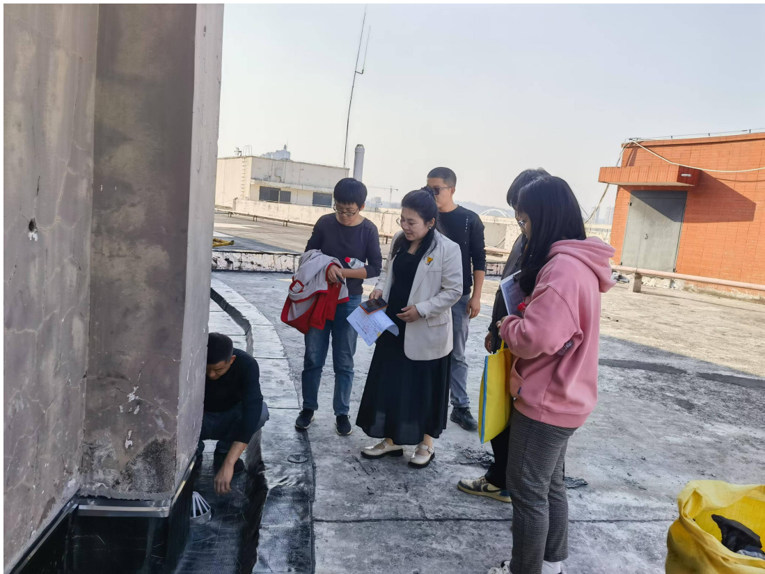
验收第一教学楼屋面防水维修