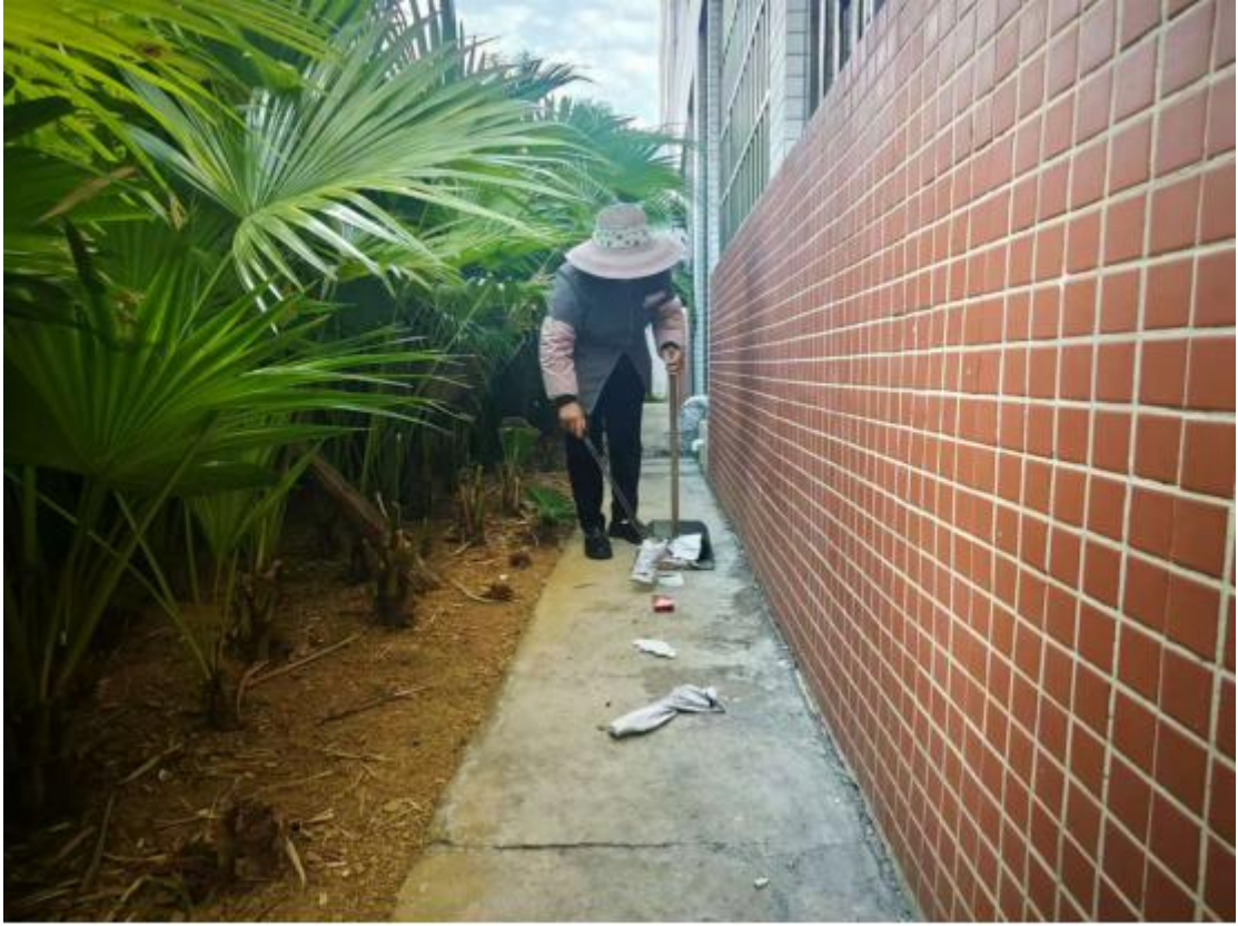
清洁H4宿舍卫生死角