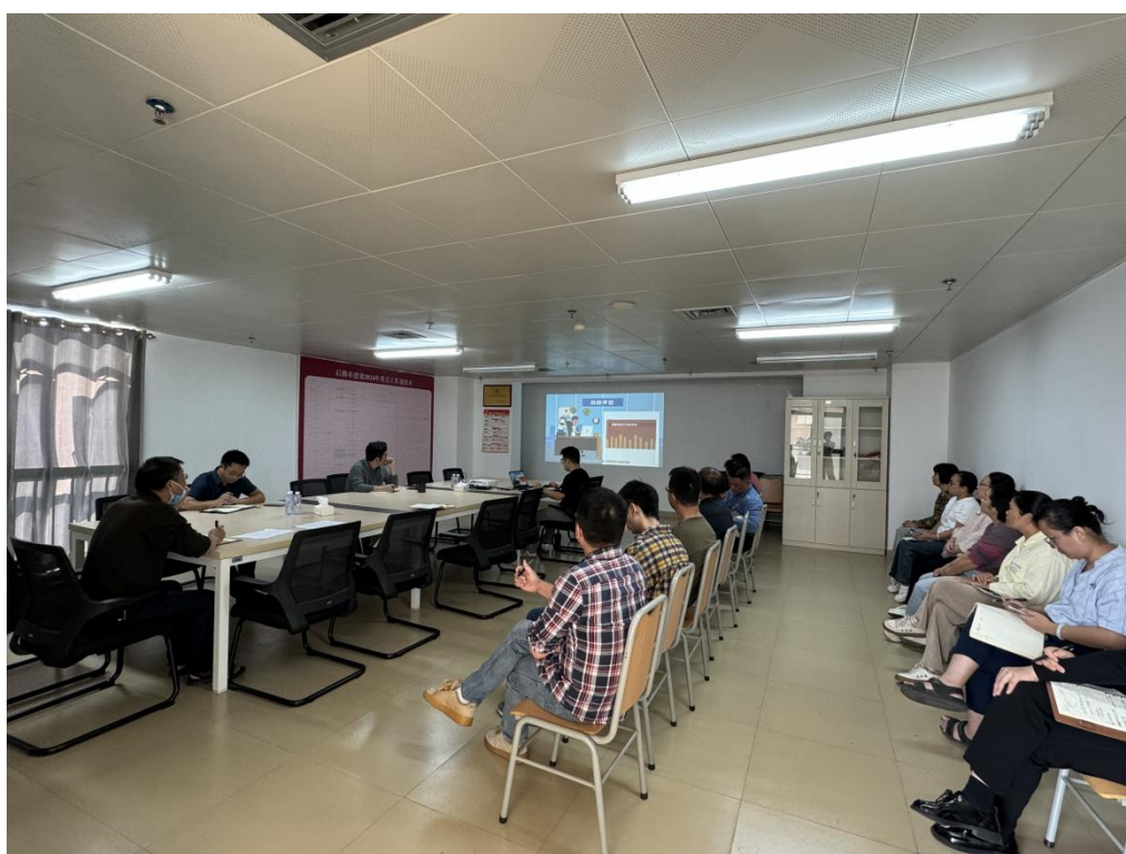
本科教学工作合格评估专题学习会现场