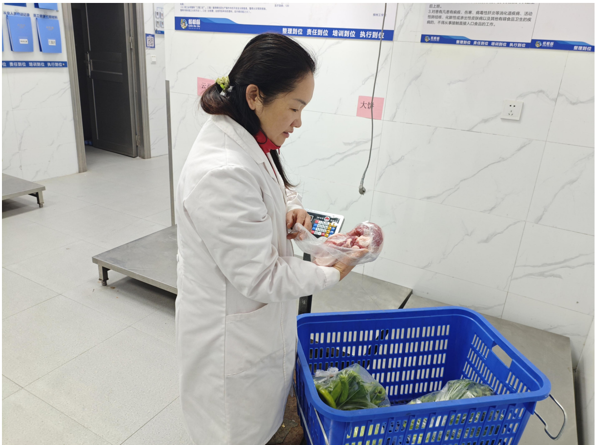
参与学校食堂食材验收及食品安全检查